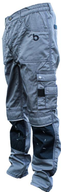
Pantalone Multitasche tessuto misto 8035 KIT B1

Per quanto riguarda gli altri indumenti, si è deciso di riproporre le stesse tipologie apprezzate in passato.