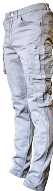
Pantalone Multitasche tessuto elasticizzato 8115 KIT B2

CASSA EDILE DI MUTUALITÀ ED ASSISTENZA DI BELLUNO E PROVINCIA